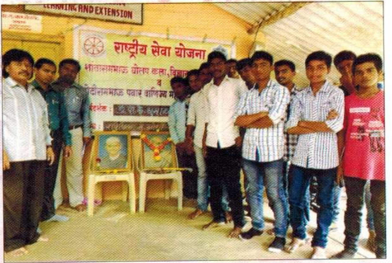
म. गांधी व लालबहादूर जयंती साजरी करतांना स्वयंसेवक विद्यार्थी