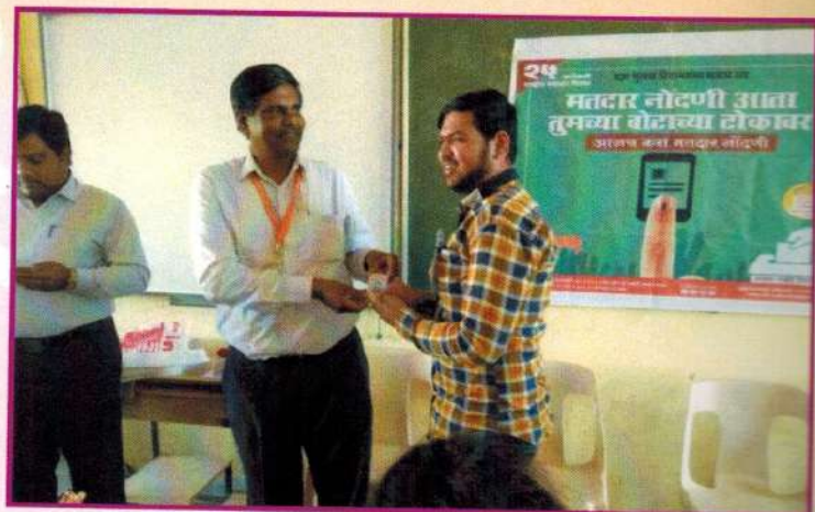
मतदार नोंदणी जनजागृती