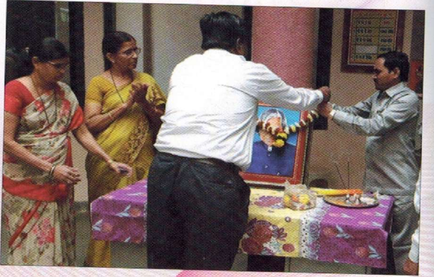
डॉ. अब्दुल कलाम यांना जयंतीनिमित्त अभिवादन करतांना प्राचार्य व प्राध्यापक वृंद