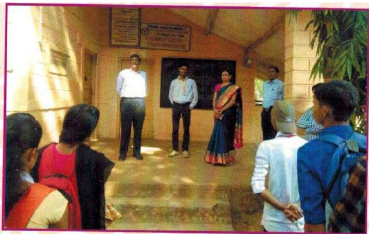
संविधान दिन कार्यक्रम