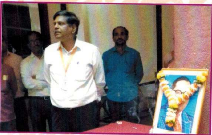
डॉ. बाबासाहेब आंबेडकर महापरीनिर्वाण दिन