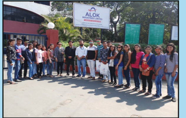
बी.एम.एस विभाग आयोजित औद्योगिक स्थळ भेट, ठिकाण – सिल्वासा