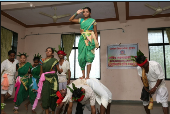
युवा महोत्सवात पारंपरिक नृत्य सादर करताना स्पर्धक