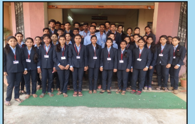
आय.टी. विभाग आयोजित क्षेत्रीय सर्वेक्षण कार्यक्रमात सहभागी विद्यार्थी