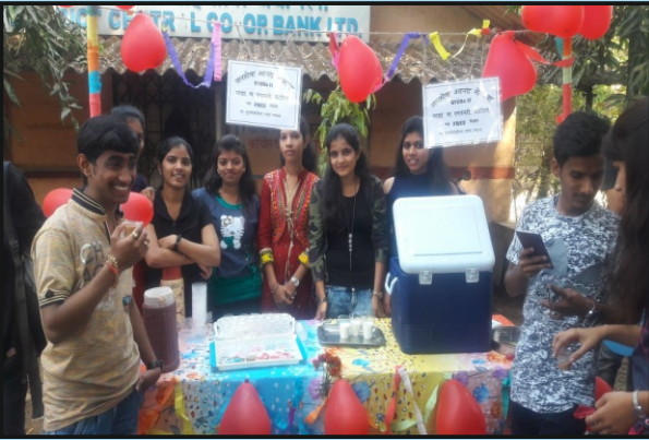
जनसेवा, कला सांस्कृतिक महोत्सवा अंतर्गत आनंदमेळयातील स्टॉलधारक विद्यार्थी