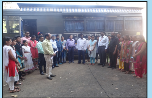
मुंबई विद्यापीठ विद्यावाहिनीचे महाविद्यालयात स्वागत करताना प्राचार्य, प्राध्यापक व विद्यार्थी