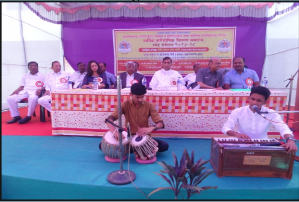
वार्षिक पारितोषिक वितरण कार्यक्रम प्रसंगी ईशस्तवन सादर करताना विद्यार्थी