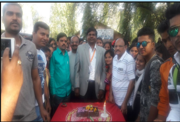
जनसेवा, कला सांस्कृतिक महोत्सवा अंतर्गत आनंदमेळा उद्घाटन प्रसंगी प्राचार्य, उपप्राचार्य, प्राध्यापक व विद्यार्थी