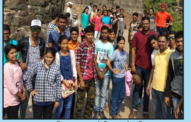
रसायनशास्त्र विभाग आयोजित शैक्षणिक सहल ठिकाण मुरुड – जंजीरा