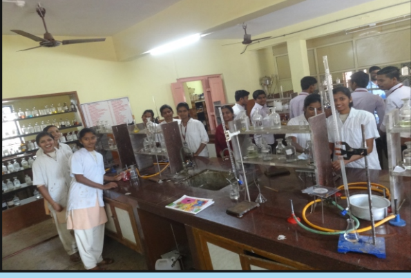
रसायनशास्त्र विभागाची सुसज्ज प्रयोगशाळा