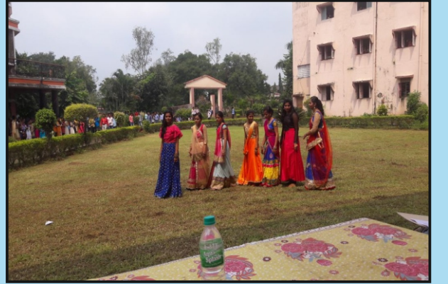
वाणिज्य विभाग आयोजित गरबा नृत्य स्पर्धा