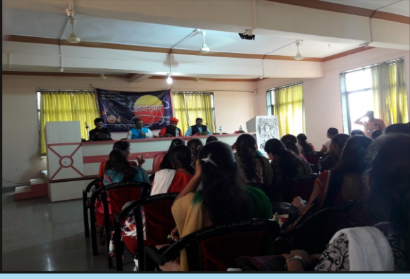
निसर्ग मित्र मंडळ आयोजित आगरायन काव्यमैफल अनुभवताना विद्यार्थी