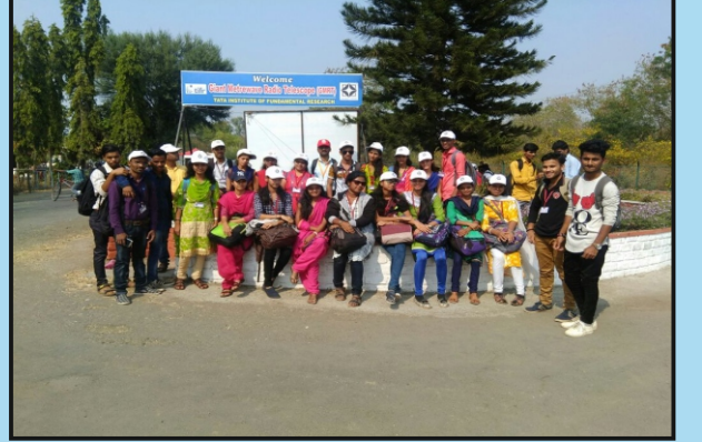
भौतिकशास्त्र विभाग आयोजित शैक्षणिक सहल ठिकाण जी.एम.आर.टी संशोधन केंद्र, पुणे.