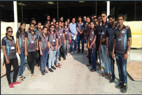
बी.एम.एस विभाग आयोजित औद्योगिक स्थळ भेट, ठिकाण – सिल्वासा