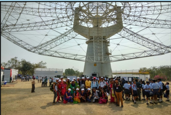
भौतिकशास्त्र विभाग आयोजित शैक्षणिक सहल ठिकाण जी.एम.आर.टी संशोधन केंद्र, पुणे.