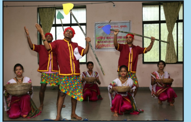
युवा महोत्सवात पारंपरिक नृत्य सादर करताना स्पर्धक