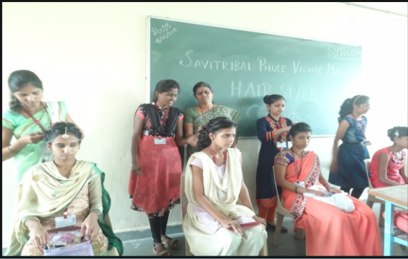
सावित्रीबाई फुले विचारमंच आयोजित केशरचना स्पर्धा