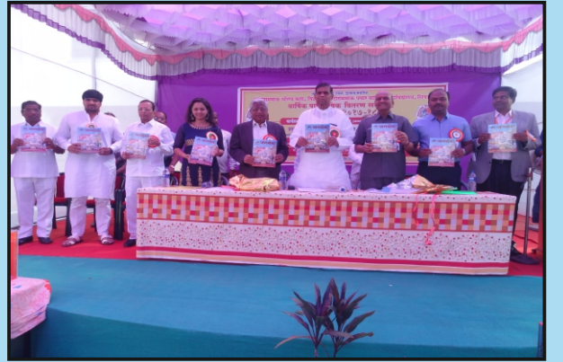
जनसेवा वार्षिकांक प्रकाशित करताना मा. गो. प. पवार साहेब व इतर मान्यवर