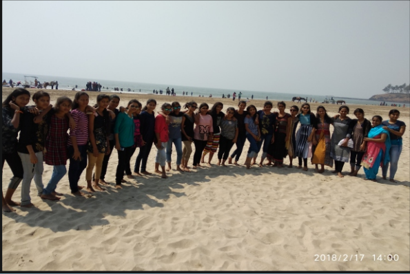
रसायनशास्त्र विभाग आयोजित शैक्षणिक सहल ठिकाण मुरुड – जंजीरा