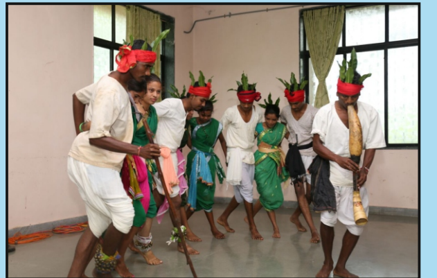
युवा महोत्सवात पारंपरिक नृत्य सादर करताना स्पर्धक